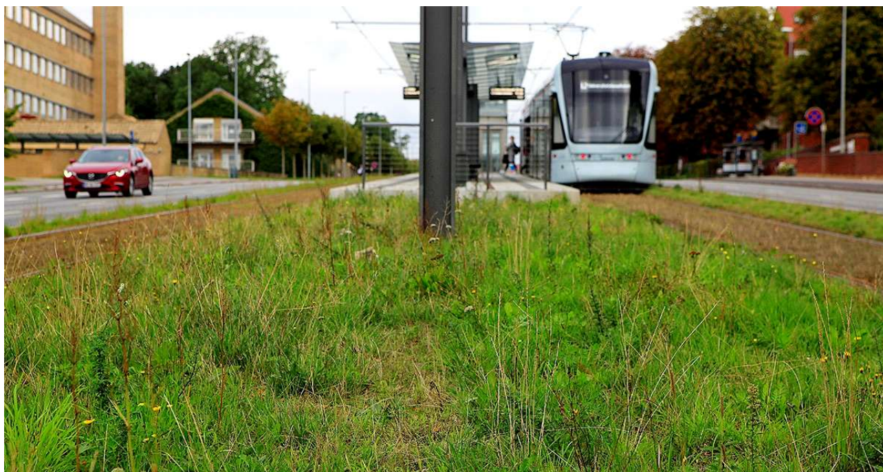
Aarhus Letbane er eldrevet og en vigtig del af Aarhus Kommunes målsætning om at gøre byen CO2-neutral i 2030.

Letbanetogene kører fra kl. 4.30 om morgenen til godt midnat hver dag. Kun om natten samles de i Trafik- og Servicecentret, hvor de serviceres, rengøres og repareres, hvis det er nødvendigt.