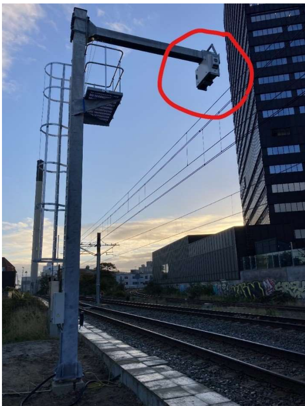
Pantoinspect-systemet ved Aarhus H. Selve scanneren ses i den røde boble.