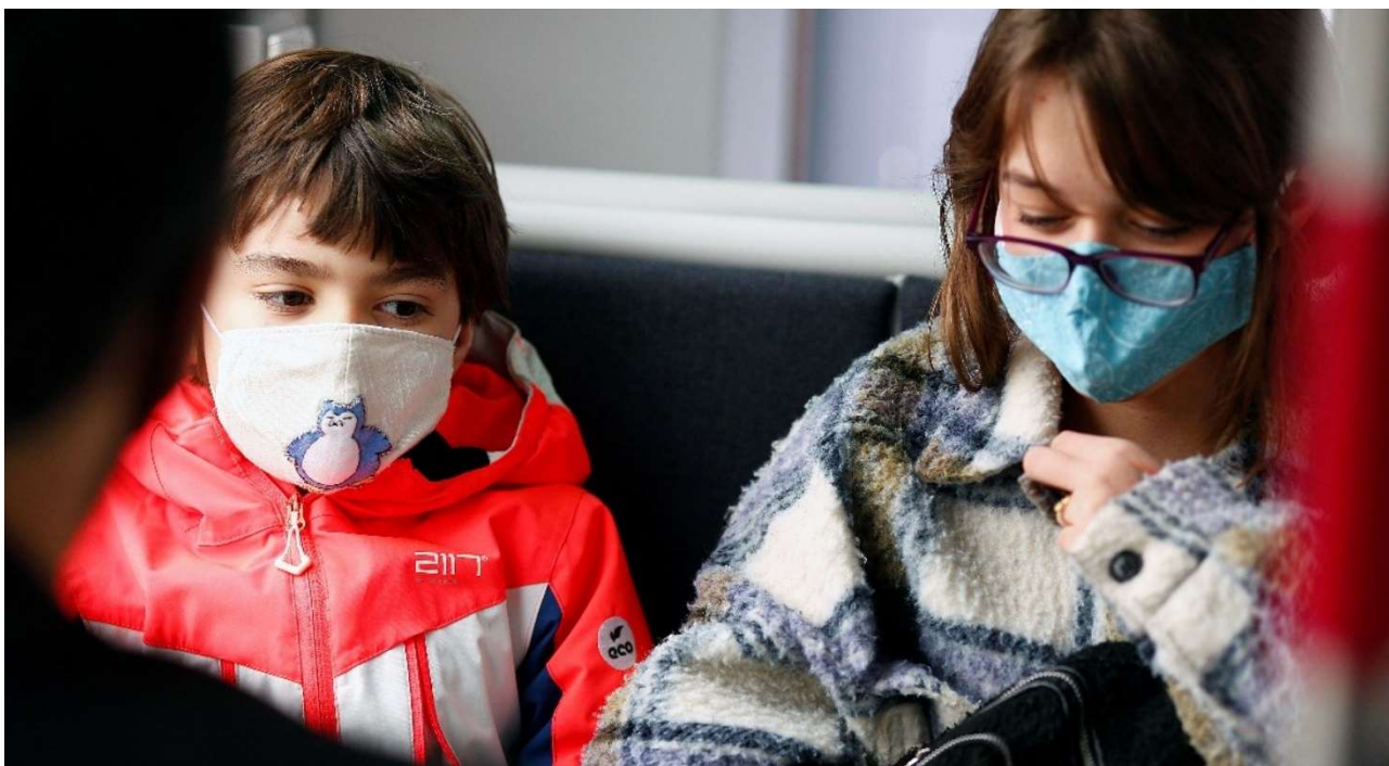
Mundbind og god afstand blev en del af Letbane passageres hverdag under Covid-19.

For passagerantallet har Covid-19 haft betydelige konsekvenser for Letbanen. Frygten for smitte, anbefalinger fra myndighederne om ikke at benytte kollektiv trafik, ændrede arbejdsvaner i form af hjemmeundervisning og hjemmearbejde samt ændrede transportvaner har givet en tilbagegang for hele den kollektive trafik på op til 40 procent. Ifølge Midttrafiks opgørelse kørte i alt 4,0 mio. passagerer med Letbanen i 2021 mod 4,7 mio. passagerer i 2019 og 3,5 mio. i 2020. Det er en tilbagegang for Letbanen på 15 procent siden 2019, men en fremgang på 14 procent siden 2020.