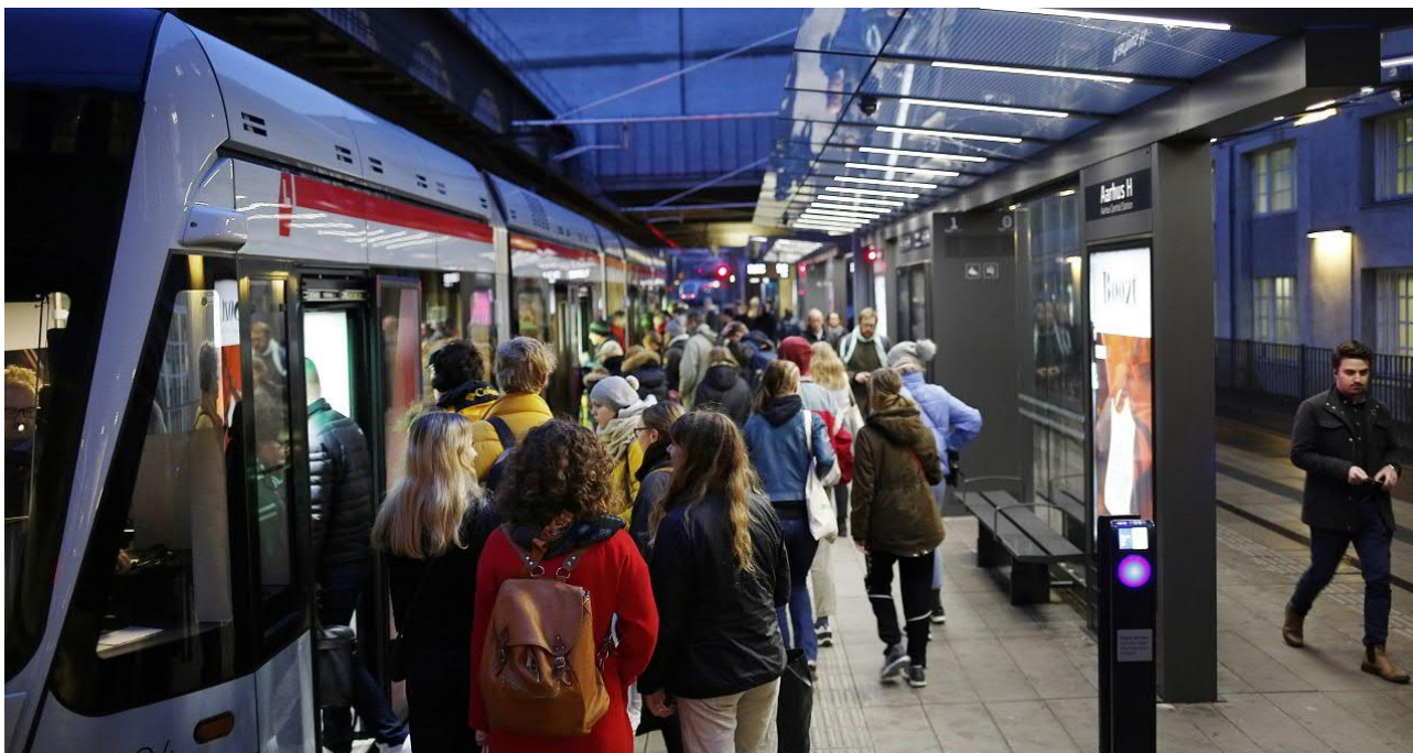
Livlig trafik til Aarhus Letbanes morgenafgang på Aarhus H.