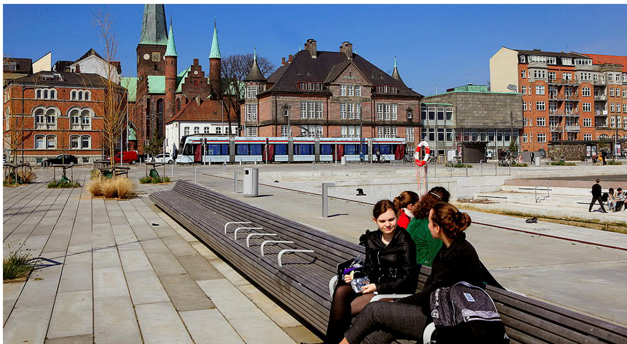
I 2019 blev Aarhus Letbane en fast bestanddel af bybilledet i Aarhus – her på Havnepladsen foran Katedralskolen.