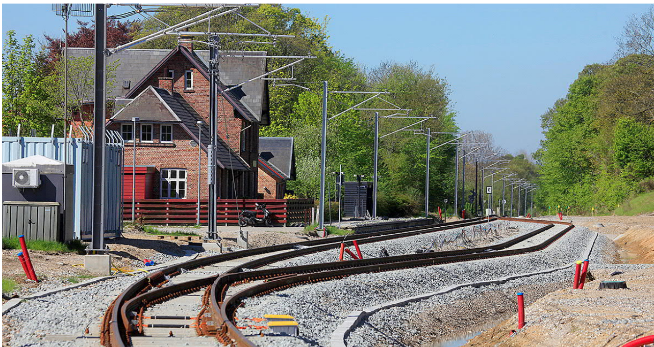
Krydsningssporet her ved Trustrup Station gør det muligt at øge antallet af afgange mellem Aarhus og Ryomgård.