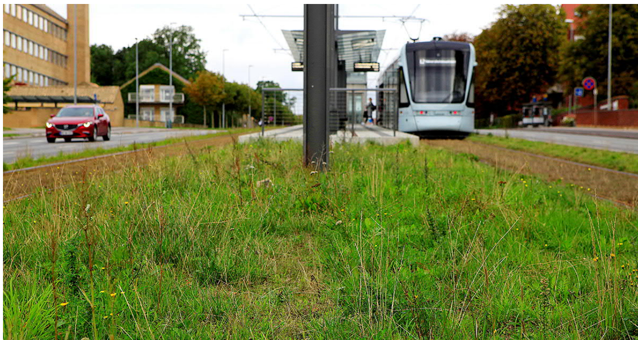
Aarhus Letbane er eldrevet og en vigtig del af Aarhus Kommunes målsætning om at gøre byen CO 2 -neutral i 2030.

Letbanetogene kører fra kl. 4.30 om morgenen til godt midnat hver dag. Kun om natten samles de i Trafik- og Servicecentret, hvor de serviceres, rengøres og repareres, hvis det er nødvendigt.