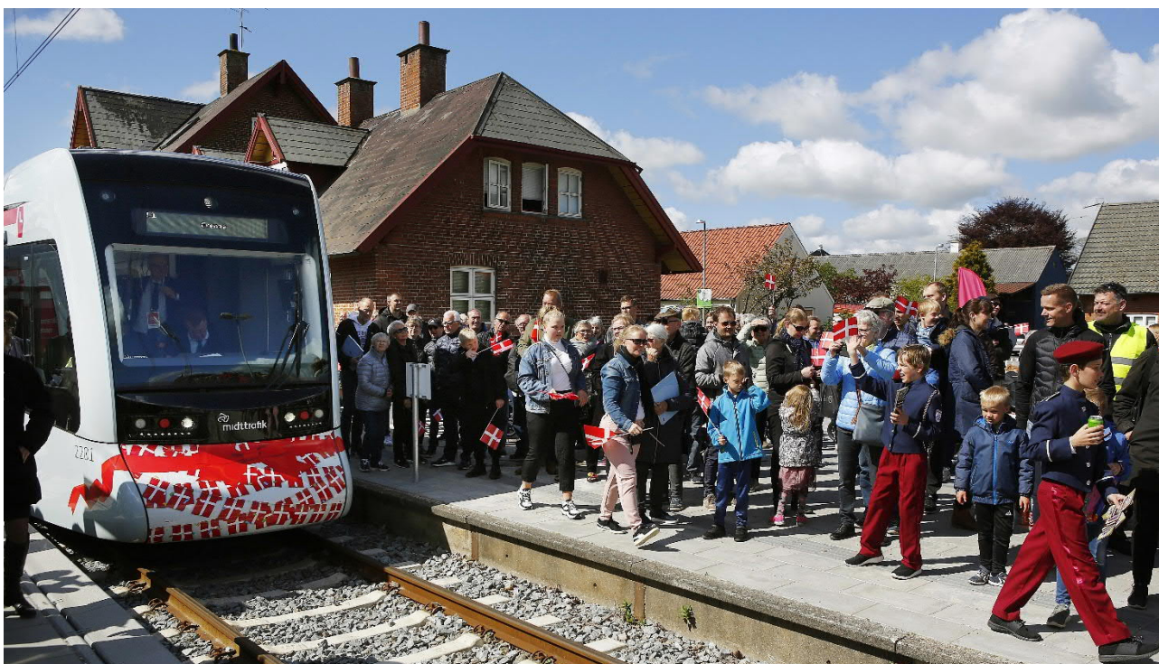
Søndag den 12. maj var publikum mødt talstærkt op for at fejre åbningen af strækningen til Grenaa.