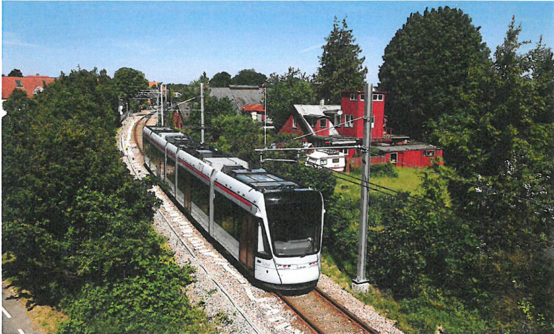
Midt på året havde Stadler leveret 23 togsæt - dermed mangler der kun tre letbanetog i flåden.