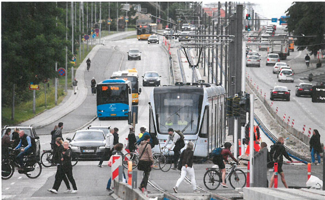
Fra Nørreport til Skejby, her Nørrebrogade, er der udlagt sand og jord i tracéet, så det kan beplantes.

På strækningen mellem Nørreport og Brendstrupgårdsvej i Skejby via Nørrebrogade, Randersvej, Nehrus Allé og Olof Palmes Allé er der udlagt sand og jord, så der kan skabes et græsklædt, grønt tracé. De første planter bliver sået i løbet af september, så tracéet ventes at stå i fuldt flor i foråret 2018.