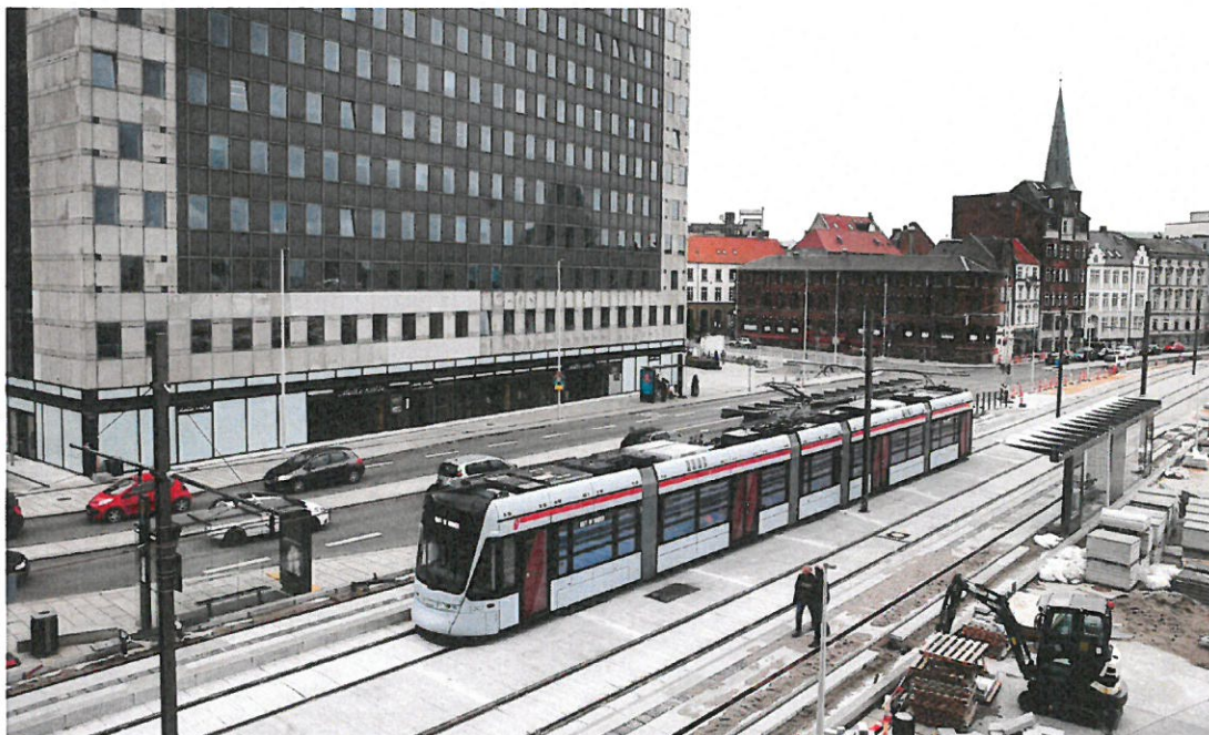
Midt på året var der også etableret kørestrøm langs den nye havnefront – her ved DOKK1.