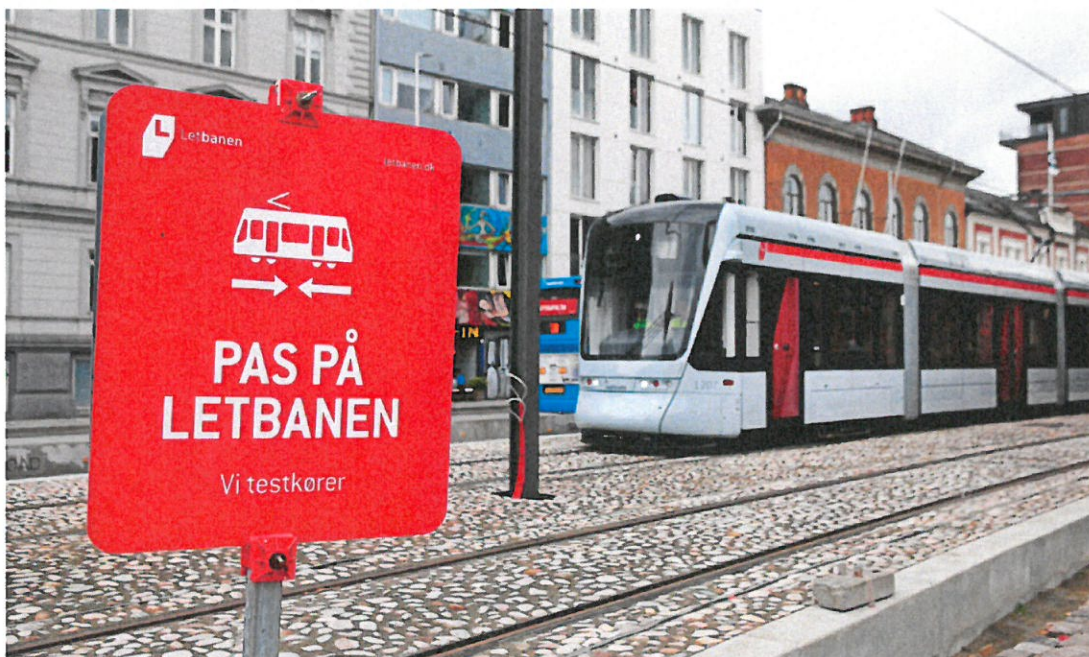
Skilte langs teststrækningen skal gøre trafikanterne opmærksomme på den nye gigant i gadebilledet.

Sikkerhedskampagnen har fået god mediedækning. Baseret på tilbagemeldinger fra bl.a. letbaneførerne, vil Aarhus Letbane løbende vurdere, om kommunikationsindsatsen omkring trafikikkerhed skal ændres eller intensiveres.